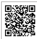
お申し込みQRコード

訪問リハビリテーションフォーラム2013 申込用紙 FAX:052-911-2803