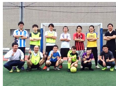
フットサルチーム