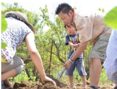
アグリ(農業活動)体験