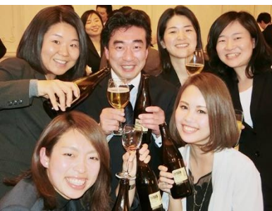
経営方針発表会後の懇親会