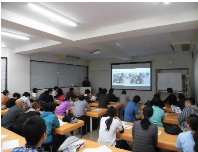
ブラッシュアップ