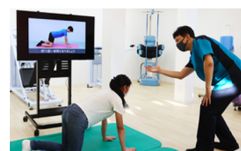
運動療法指導の風景