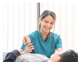
女性PTも3名在籍し活躍しています!

社会保険完備、交通費支給、制服支給、理学療法士協会年会費補助、研修会参加補助、有給休暇あり、産休、育休あり