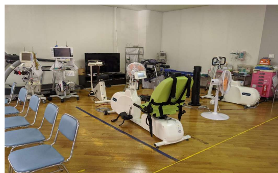
心臓リハビリスペース