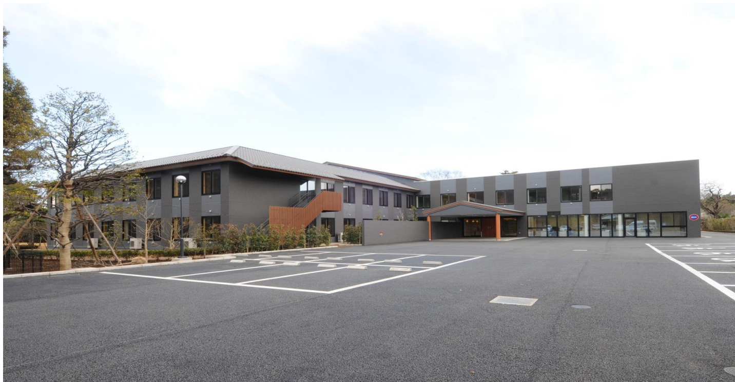
介護老人保健施設 葵の園・野田