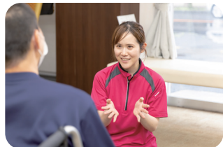
モニタリング作成