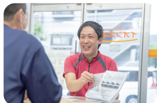
サービス担当者会議