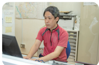
通所介護計画作成