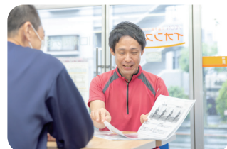
見学対応・契約管理