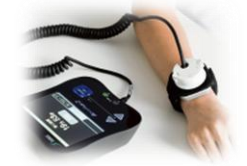
干渉型低周波治療(除痛) 超音波治療器(組織治療)