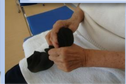
靴下を使った巧緻練習