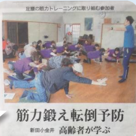
筋力鍛え転倒予防

新田小金井町の「小金井ヘルスサロン」で開かれた転倒防止教室へ講師として参加した時の様子です