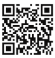
事業所ホームページ