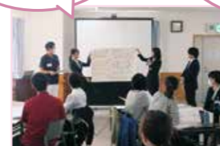
あいセーフティネット連携研修

研修では違う事業所の職種とケース検討模擬も行い、互いの価値観を学ぶ良い機会になりました