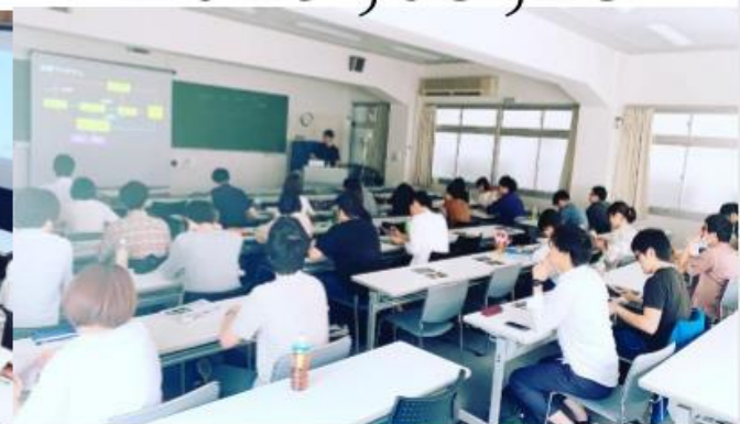
福岡会場 内反抑制法