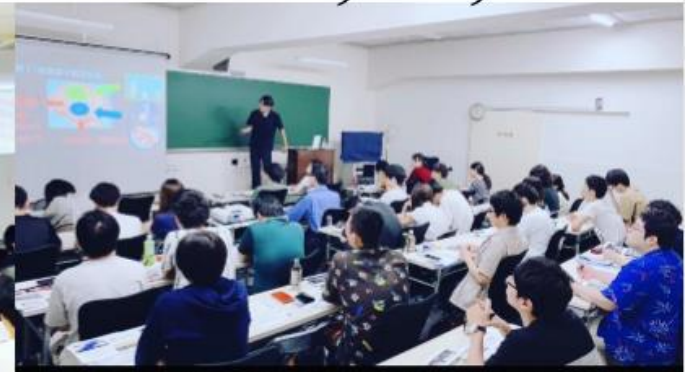
北海道会場 筋緊張抑制法